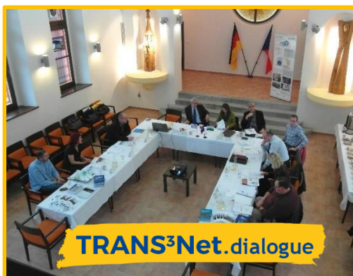
TRANS 3 Net.dialogue

Rok 2019 odstartujeme první ze dvou diskuzí u kulatého stolu na tzv. TRANS 3 Net.dialogue. Diskuze se bude konat dne 1. února 2019 v Centru start-upů a služeb (GDZ) v německém Annabergu v Krušných horách se zaměřením na "Udržitelnost sítě podporovatelů transferu vědomostí a technologického transferu". Co to znamená zejména pro TRANS 3 Net? Jaká jsou očekávání směrem k politickému prostředí a podporovatelům transferu zahrnutých ve společně vytvořené síti a jaké jsou podmínky pro spolupráci? Jaké jsou dlouhodobé výhody sítě pro aktéry inovačního systému? Rádi bychom prodiskutovali tyto otázky se zástupci politické sféry. Zváni jsou podporovatelé transferu a zástupci veřejné sféry z území Saska, Dolního